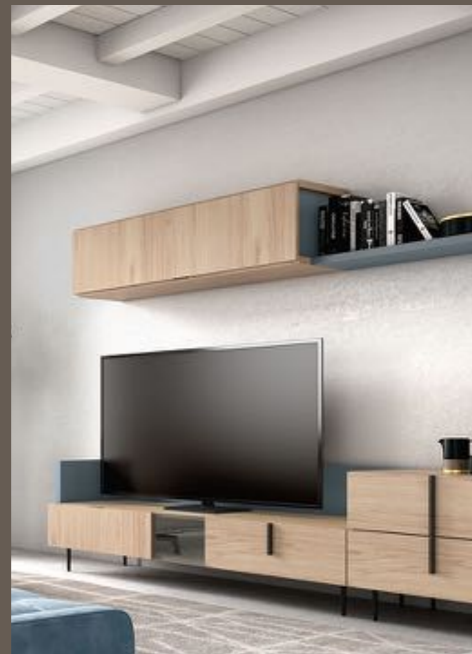
Composición salón: 899€

El verano nos invita a sentirnos en contacto con la naturaleza, por eso los muebles o los accesorios en colores claros y naturales nos ayudarán a sentir la frescura que todo hogar necesita durante los meses de calor.