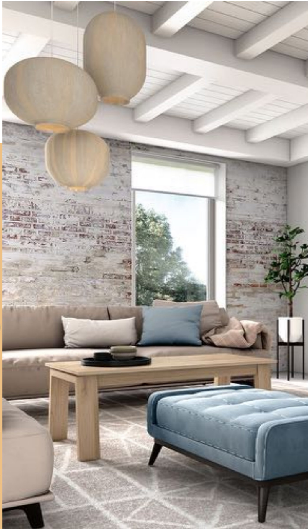
Foto de ambiente

Durante el verano siempre buscamos una decoración refrescante y llena de vitalidad. Pero a veces puede llevarnos a sentir monotonía, por eso es importante elegir un estilo atemporal que nos acompañe durante toda la temporada.