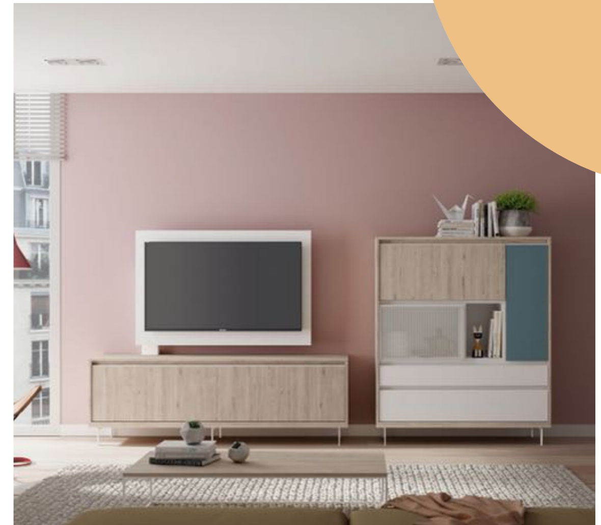
Composición salón: 1.599€

Durante el verano siempre buscamos una decoración refrescante y llena de vitalidad. Pero a veces puede llevarnos a sentir monotonía, por eso es importante elegir un estilo atemporal que nos acompañe durante toda la temporada.