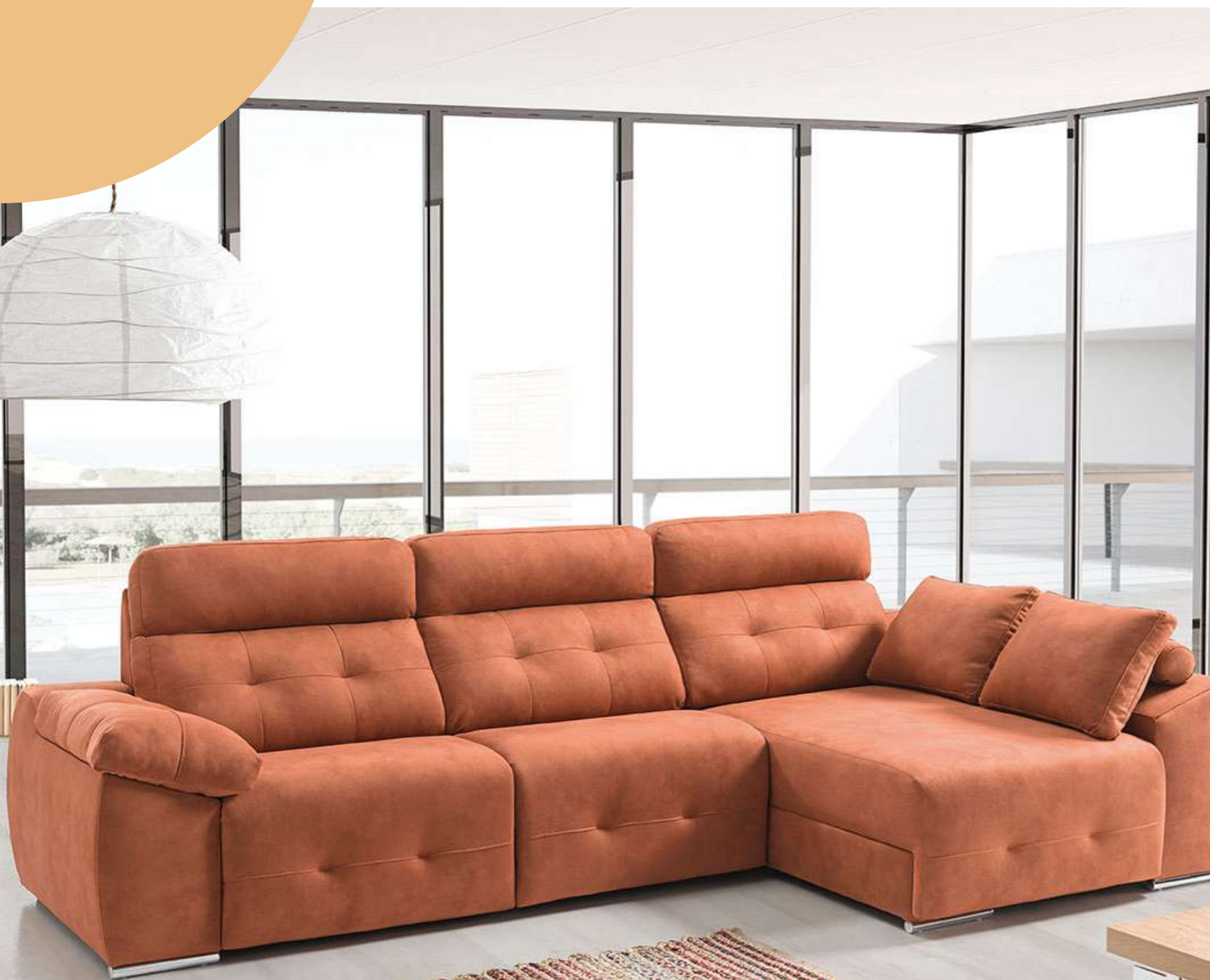
Sofá 3 plazas relax con chaise longue de arcón: 1.879€.