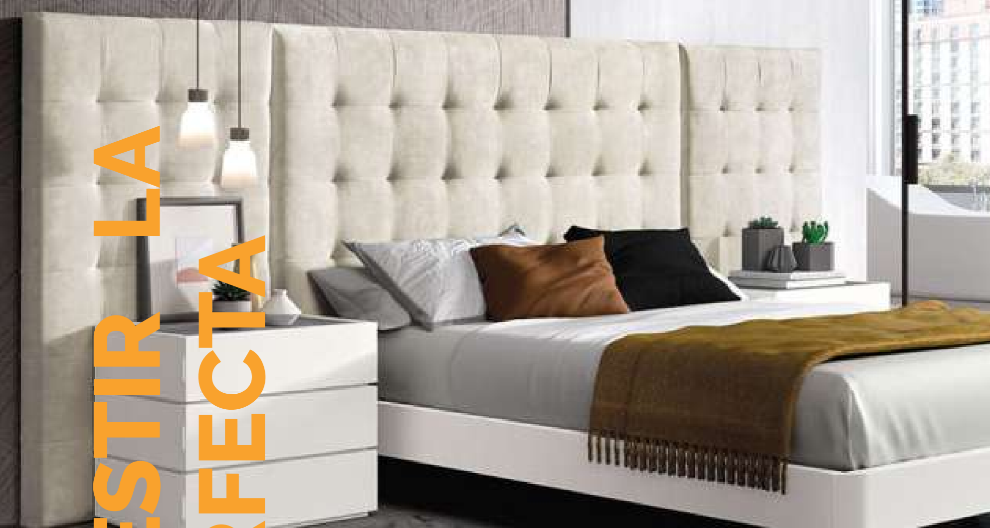
Composición dormitorio: 2.599€.