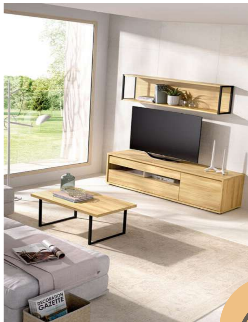
Conjuto salón: 949€.