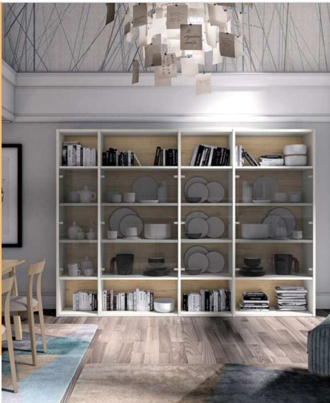
Composición sala de estar: 2.779€.

El clásico entre los clásicos. Aporta luminosidad, frescor, aumenta la sensación de amplitud... ¿Qué más se le puede pedir a una tonalidad?