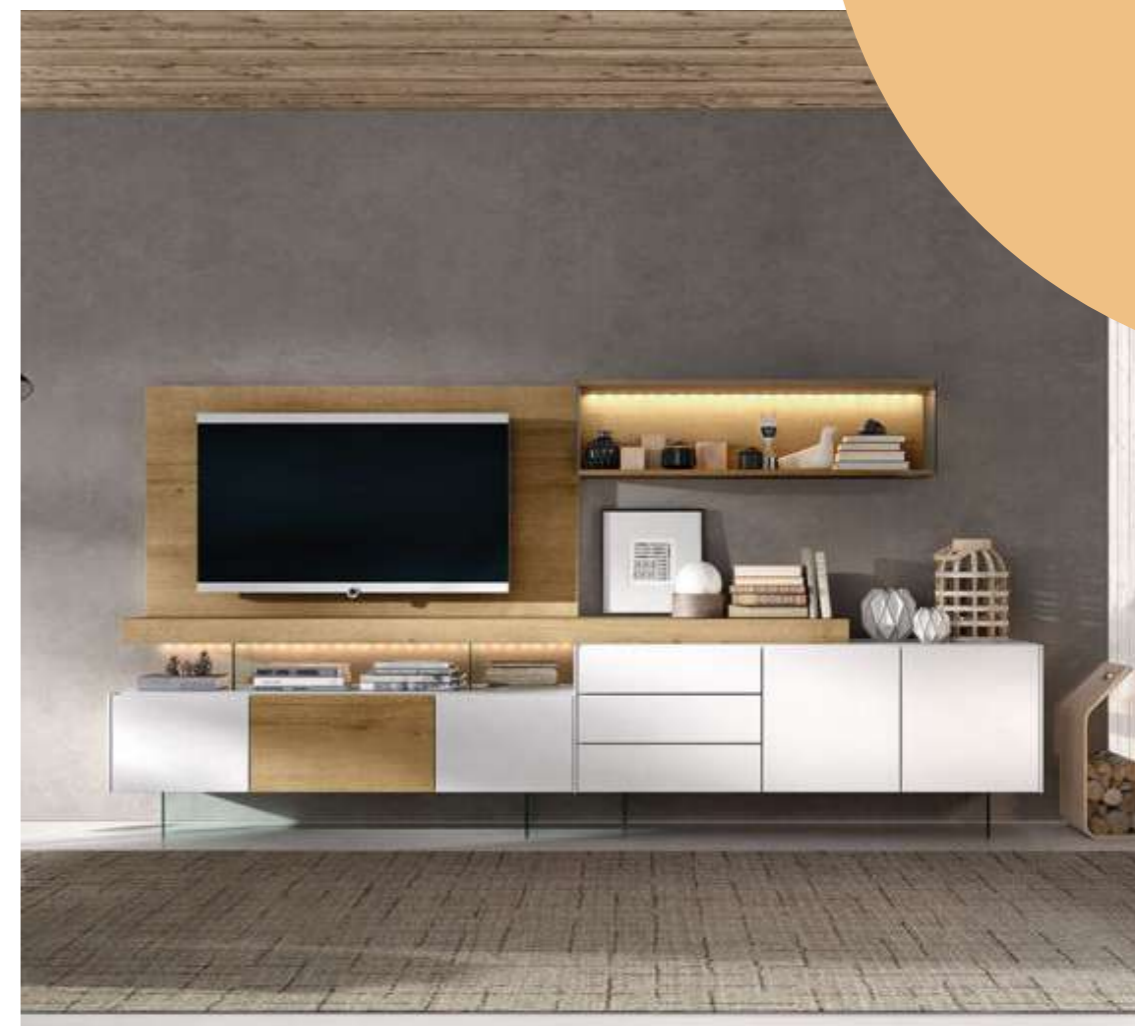
Composición salón: 1.749€.

Parece imposible no relacionar verano y mediterráneo. Por eso, este estilo tan nuestro es el perfecto no solo para poder soportar el calor, sino para llevarlo con el máximo estilo posible. ¿Preparado para un verano al más puro estilo mediterráneo?