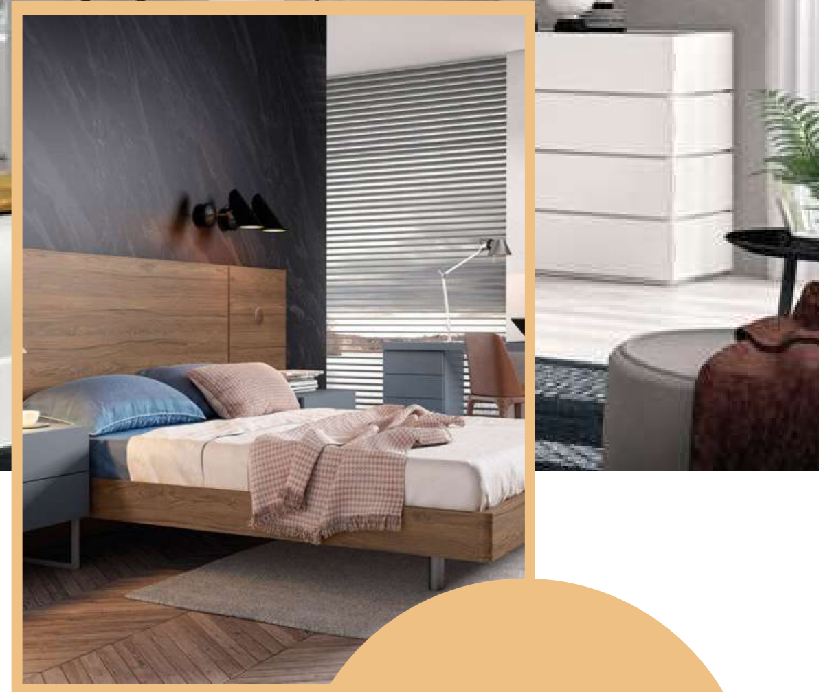
Muebles dormitorio: 1.789€.

Una vez realizados esos ejercicios, solo queda elegir tu estilo favorito. Opta por un edredón con estampado para hacer de tu cama el centro de la habitación, consigue el "total white" manteniendo todo blanco, usa colores que armonicen con la deco... ¡Lo más importante es poder personalizarlo 100%!