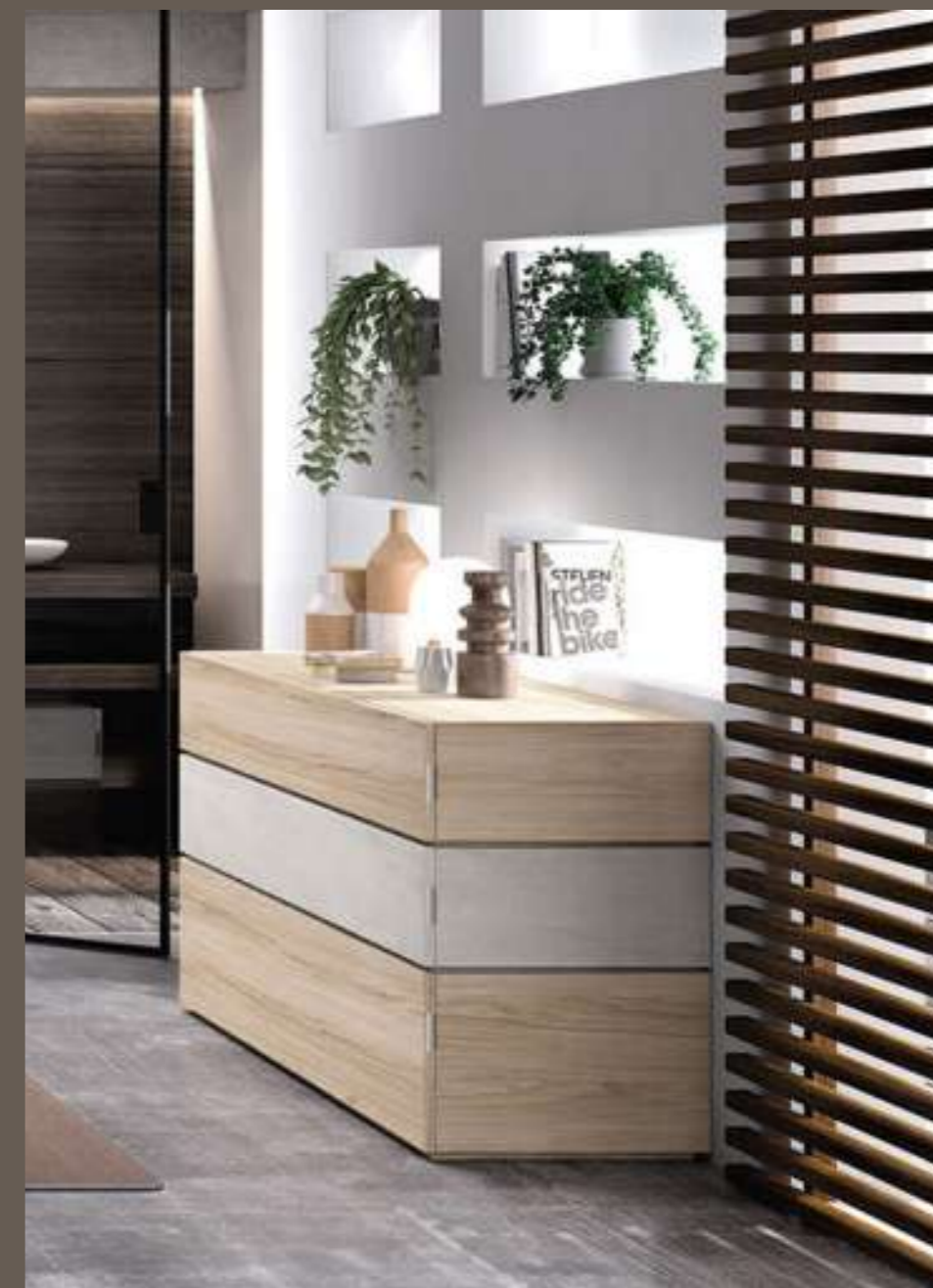
Composición dormitorio: 449€

Como buenos expertos en la gestión del calor, los mediterráneos sabemos de la importancia de tener buenas ventanas, pero también persianas y estores o cortinas. Opta por un color blanco que ondee perfecto en tu hogar.