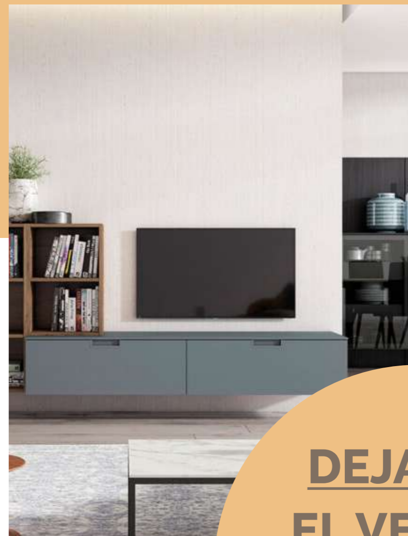
Conjunto salón: 849€.