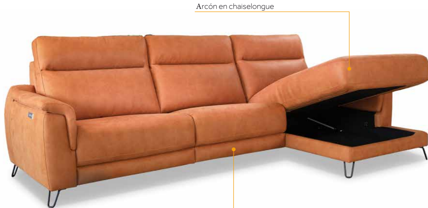
Arcón en chaiselongue